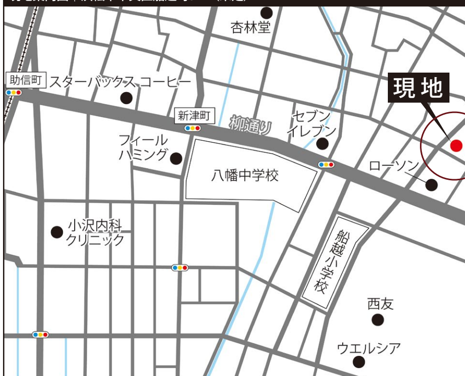
現地案内図 | 浜松市中央区船越町37-2 (未定)